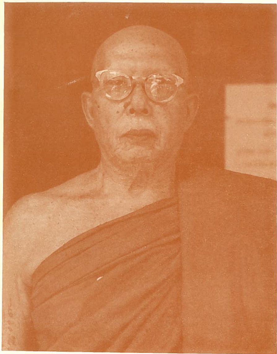
ທາງຊຸ່ ສຸກາ ກາຍສີໂສ